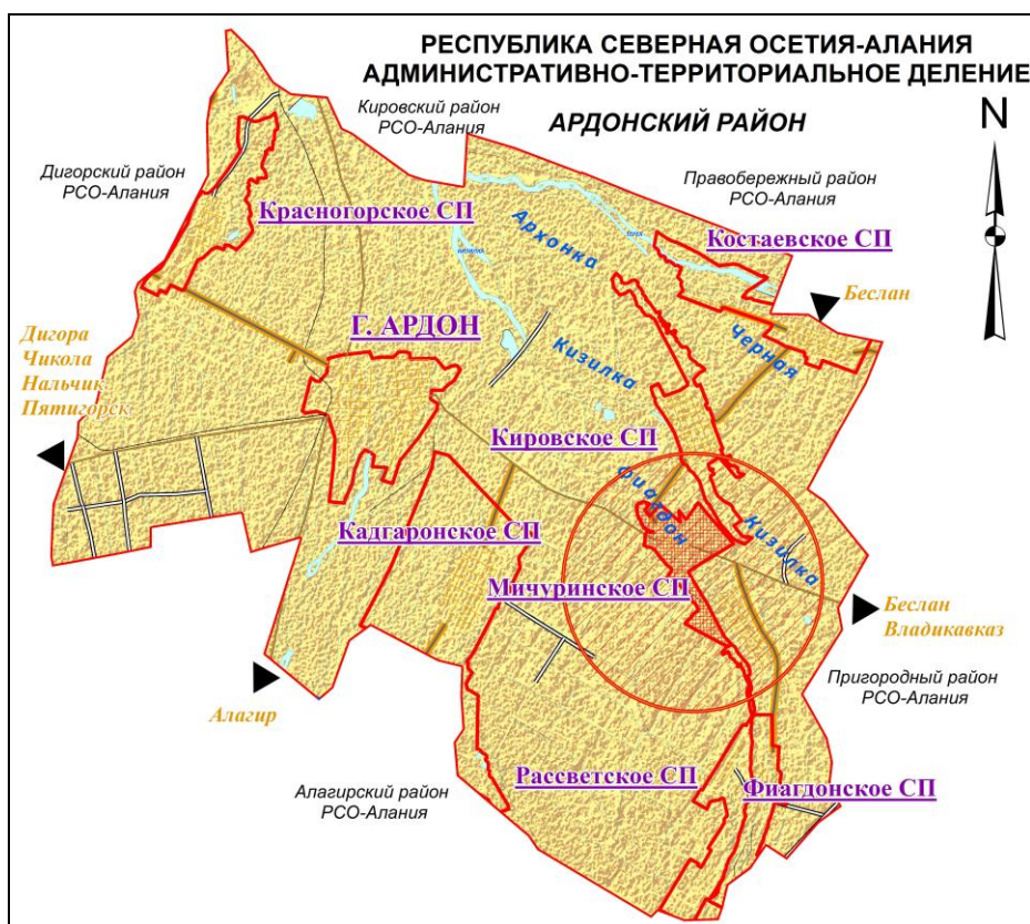
Рисунок 1 Границы поселений