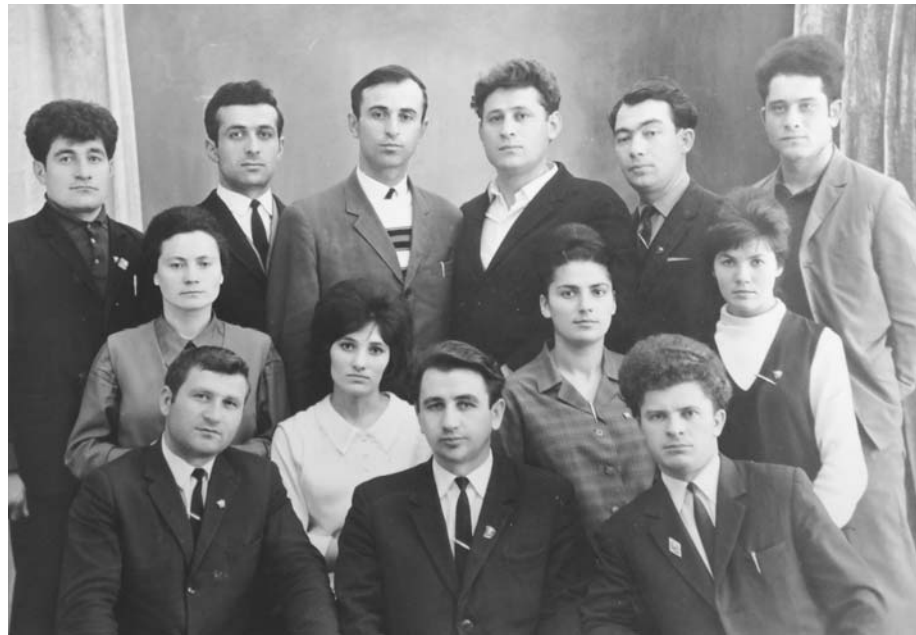
Æрыдоны районы фæскомцæдисон организацийы делегаттæ ФÆЛКЦ-ы областон конференцийы. 1967 аз.